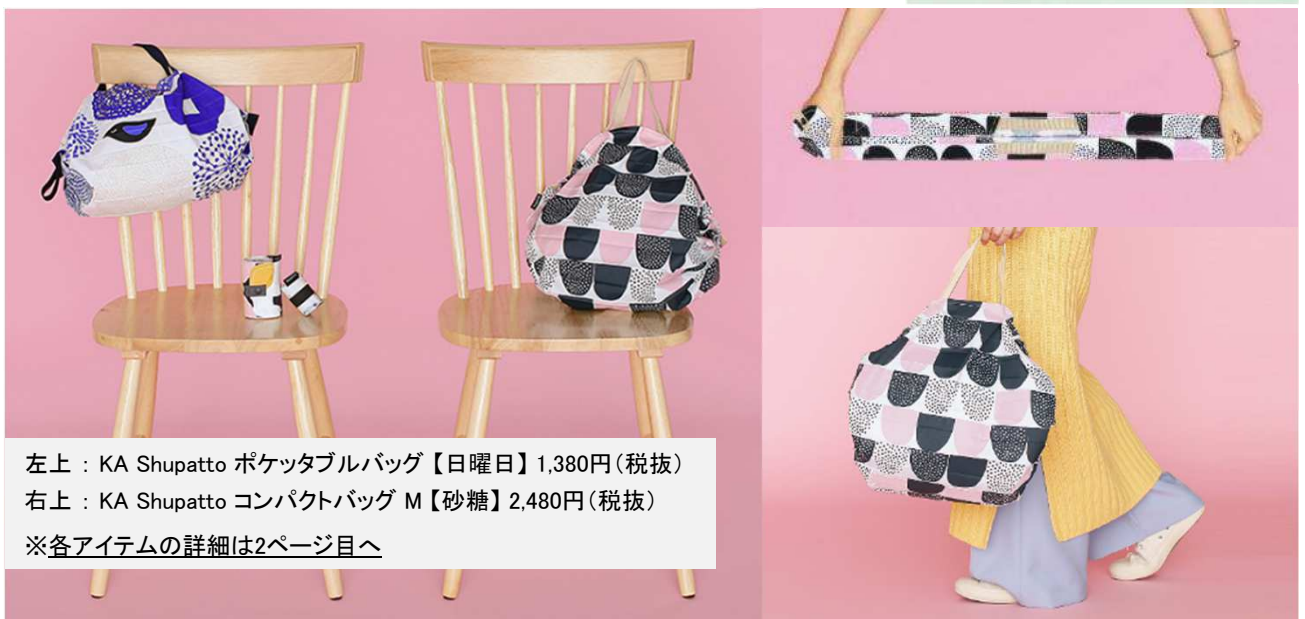
左上 : KA Shupatto ポケットタブルバッグ【日曜日】1,380円(税抜) 右上 : KA Shupatto コンパクトバッグ M【砂糖】2,480円(税抜) ※各アイテムの詳細は2ページ目へ