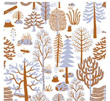
(テキスタイルパターン) 左から砂糖、日曜日、パンジー、森