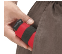
ポケットに入るサイズ