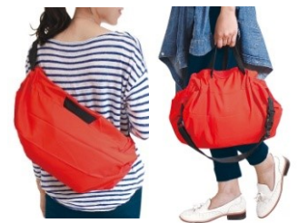
ショルダーバッグ、 ハンドバッグの2通りで使える