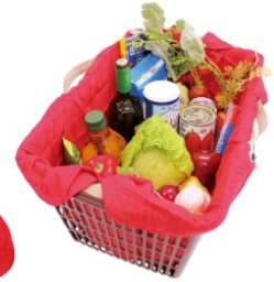
レジカゴにかけられる ビッグサイズ